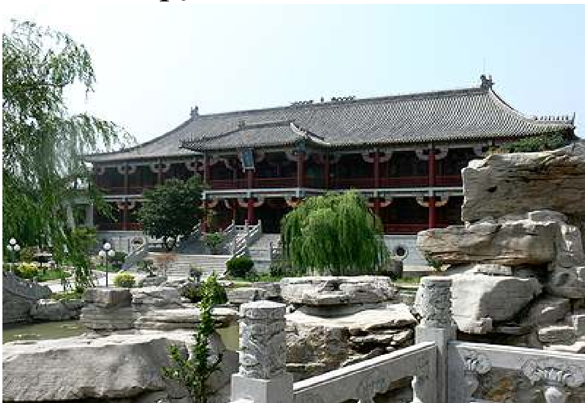
Haņ din. Mingtang

visaugstākais sencis 帝 di gaismas halle 明堂 mingtang imperatora templis senču tempļi 祖庙 zumiao